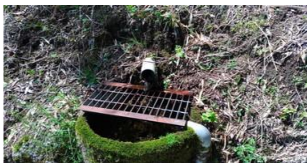
建物横の道沿いに湧き水あり。