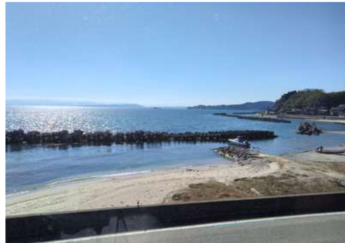
石川県と富山県の県境（氷見市） 少しくぼんだ波が穏やかな場所 海岸一列目の土地です